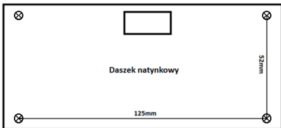
Rys. 1 Rozstaw otworów montażowych centrali wraz z daszkiem natynkowym. Średnica otworów: 5mm